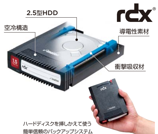
ハードディスクを挿しかえて使う 簡単信頼のバックアップシステム